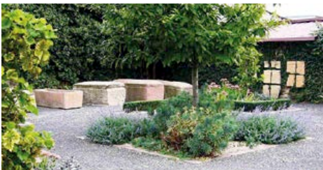
Bild: Blick auf das Römergärtchen mit den Sarkophagen aus der Grabungskampagne des Jahres 2001.

Die im Jahre 2001 in Gönnheim zu Tage gebrachten steinernen Sarkophage und Holzsargreste enthielten Schmuckgegenstände, Lampen, Fibeln aus Bronze und zum Teil aus Silber sowie römische Münzen. Neben Gefäßen aus Terra Sigillata fand man eine große Zahl prächtiger Gläser, unter denen Einzelstücke in der Pfalz bislang gar nicht oder selten vorkamen. Die Funde werden in die Mitte des 4. bis zum frühen 5. Jahrhundert datiert.